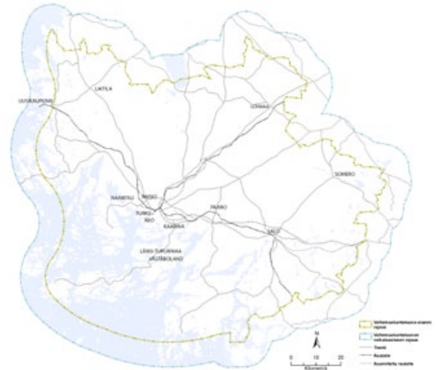
Vaihemaakuntakaavan kaava-alue ja vaikutusalueen raja

Laadittavan vaihemaakuntakaavan välittömät vaikutukset kohdistuvat tuulivoima-alueiden ja uusien sähkölinjojen läheisyyteen. Tuulivoima-alueiden osalta vaikutusalueen laajuus ulottuu tuulivoimaloiden aiheuttamien maisemavaikutusten takia jopa noin 10 kilometrin etäisyydelle. Merkittävimmät vaikutuksen kohdentuvat kuitenkin noin 1-5 kilometrin etäisyydelle suunnitelluista tuulivoima-alueista. Vaikutusalueen laajuus tarkentuu kaavasuunnittelun aikana.