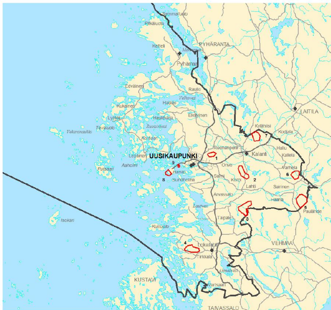
Kuva 1. Kartalla on kuvattu punaisella rajauksella tuulivoimarakentamiseen soveltuvat alueet: Autotehdas 1, Korpi 2, Taipale 3, Muntila 4, Pehto 5, Varhela 6, Kylähiisi 7, Hangonsaari 8 ja Hyttyskari 9.

Uudenkaupungin alueella ja lähikunnissa on käynnissä useita tuulivoimahankkeita. Tuulivoimayleiskaavaan merkityistä alueista on tuulivoimarakentaminen suunnitteilla Muntilan (rakennusluvat korkeimmassa hallinto-oikeudessa), Hangonsaarella kahdelle tuulivoimalalle, joista toinen korvaa vanhan olemassa oleva voimalan ja toinen sijoittuisi Hyttyskarin lähelle sekä Taipaleen alueelle.