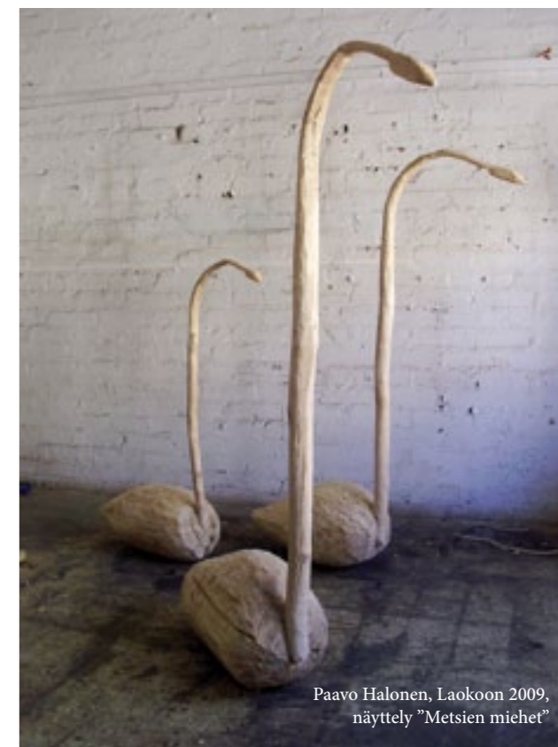
Paavo Halonen, Laokoon 2009, näyttely ”Metsien miehet”

I konstmuseet visas till den 6.1.2013 utställningen ”Metsien miehet”, där träskulpturer förenas med övrig konst med skogstematik. I utställningen medverkar nutidskonstens toppnamn och ugglor spelar en central roll.