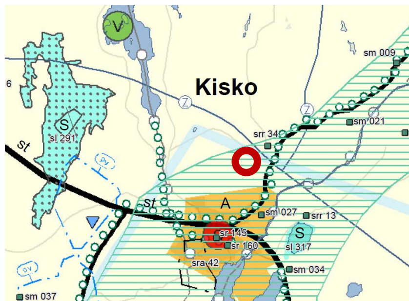
Ote Salon seudun maakuntakaavasta ja suunniteltu maa-ainesten ottamisalueen sijainti

Vahvistetussa Salon seudun maakuntakaavassa alue sijaitsee maa- ja metsätalousvaltaisella alueella (M) sekä kulttuuriympäristön tai maiseman kannalta tärkeällä alueella. Alueen eteläpuolella oleva Kiskon taajama on osoitettu taajamatoimintojen alueeksi (A) ja alueen pohjoispuolelle on merkitty suurjännitelinja (z). Alueen itäpuolella kulkevalle Kurkelantielle (mt 1870) on merkitty ulkoi- lureitin linjaus.